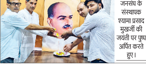
मिवानी। जनसंघ के संस्थापक श्यामा प्रसाद मुखर्जी की जयंती पर पुष्प अर्पित करते हुए।