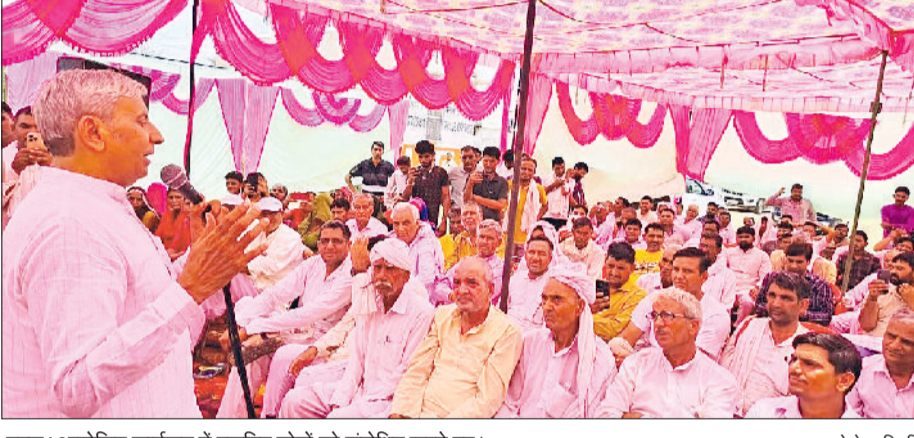
बहल। आयोजित कार्यक्रम में एकत्रित लोगों को संबोधित करते हुए।

विकसित नजर आएगा। बहल में लुवास का केन्द्र, सीवरेज, पेयजल, मॉडल संस्कृति भवन, एचएयू का एक्सिलेंस सेंटर, गरवा का मछली पालन केन्द्र जैसी योजनाएं हैं जिनके पूरा होने से बहल का नाम पूरे प्रदेश में जाना जाएगा। उन्होंने लोगों से अपील की कि वे विपक्षी लोगों के बहकावे में न आकर भाजपा का साथ दें। उन्होंने जनस्वास्थ्य विभाग के अधिकारियों से कहा कि वे इन परियोजनाओं को क्रियावित करते समय प्रयोग होने वाली सामग्री की गुणवत्ता व समय सीमा का खास ख्याल रखें। इसके अलावा वे यह भी सुनिश्चित करें कि इन परियोजनाओं के चलते किसी कस्बावासी को किसी प्रकार की