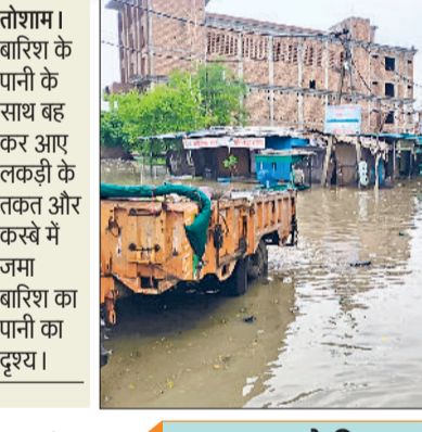
तोशाम। बारिश के पानी के साथ बह कर आए लकड़ी के तकत और कस्बे में जमा बारिश का पानी का दृश्य।