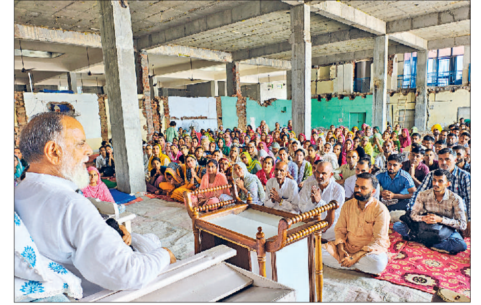
भिवानी। आयोजित सतसंग में प्रवचन देते संत कंवर साहेब।