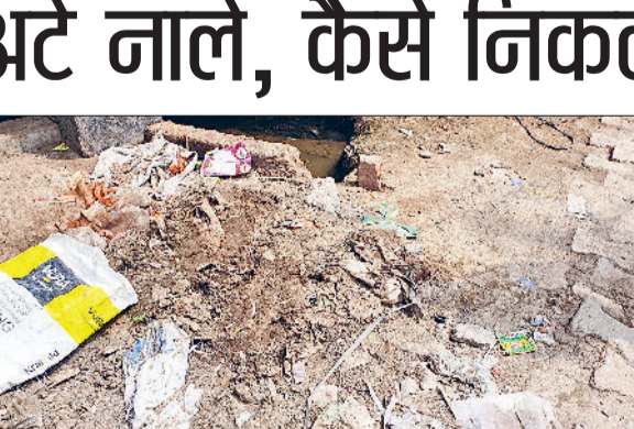
भिवानी। नालों से बाहर निकाली गई गाद पड़ी सड़क किनारे व गंदगी से अटा बरसाती पानी की निकासी के लिए बना नाला।

लगता है कि विगत में हलकी बारिश से शहर में अनेक जगह हुए जलभराव से सबक नहीं लिया। क्योंकि बारिश का सीजन शुरू होने के बावजूद भी शहर के बरसाती पानी की निकासी के लिए बनाए गए नालों की सफाई नहीं की गई है। अलिकांश शिल्ट में उपर तक शिल्ट जिमा है। शिल्ट की वजह से घरों से निकलने वाला पानी गली व सड़कों पर फैल रहा है। वहीं जिन नालों से थोड़ी बहुत शिल्ट निकाली गई है।