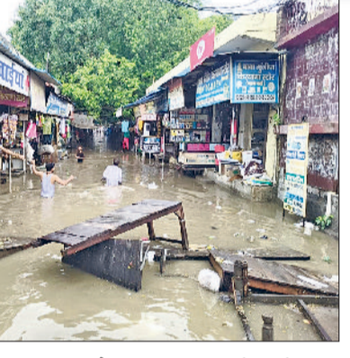
तोशाम। बारिश के पानी के साथ बह कर आए लकड़ी के तकत और कस्बे में जमा बारिश का पानी का दृश्य।

हरिभूमि न्यूज ▶▶ तोशाम रविवार तोशाम इलाके में जबरदस्त बारिश हुई। करीब 40 मिनट की बारिश ने चहुंओर पानी ही पानी कर दिया। हालात ये बने की तोशाम कस्बे के ढलान वाले इलाकों में कहीं पर डेढ़ तो कहीं पर दो फुट तक बारिश का पानी जमा हो गया। लोगों को बारिश के पानी से ही होकर गंतव्य तक पहुंचना पड़ा। हालांकि मानसून के आने से पहले प्रशासन ने बारिश के पानी की निकासी के लंबे चौड़े दावे किए थे, लेकिन पौने घंटे की बारिश ने प्रशासनिक दावों को ही बारिश के पानी में डूबो दिया। ऐसे में कस्बे में जगह जगह बरसाती पानी एकत्रित होने से दुपहिया वाहन चालकों और राहगीरों को तो परेशानी हुई ही वहीं दुकानों में बरसाती पानी घुसने से दुकानदारों को भी अनेक समस्याओं का सामना करना पड़ा। दुकानों के आगे रखे लकड़ी के तकत आदि पानी में बह कर ढलान