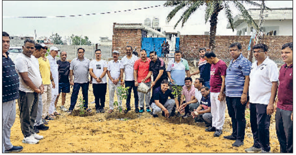
भिवानी। गोशाला में पौधरोपित करते हुए।

वहां की व्यवस्थाओं का जायजा लिया। राज्यसभा सांसद किरण चौधरी ने बताया कि वर्ष 1970 में चौ. बंसीलाल ने तत्कालीन प्रधानमंत्री इंदिरा गांधी के सहयोग से ऊंचाई पर स्थित मरूस्थलीय क्षेत्रों में सिंचाई के लिए लिफ्ट इरीगेशन