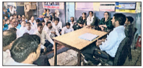
बवानीखड़ा। आयोजित मीटिंग में दिशा निर्देश देते हुए।

लोहारू। शहर के सब्जी मंडी और बस स्टैंड के बीच इलाके में इन दिनों सफाई व्यवस्था इतनी चरमराई हुई है कि यहां से गुजरने वाले राहगीरों और वाहन चालकों को काफी परेशानी का सामना करना पड़ता है। रविवार को यह स्थिति और भी अधिक बिगड़ जाती है। शहर के सामाजिक संगठनों के सदस्यों और आम लोगों ने नगर पालिका प्रशासन से सब्जी मंडी गली, बस स्टैंड से रेलवे स्टेशन के बीच और बीआरसी कार्यालय के पीछे गली की सफाई व्यवस्था बेहतर करने की मांग की है।