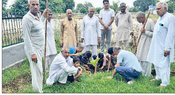
बवानीखेड़ा। मंदिर परिसर में पौधरोपित करते हुए।

मानना था कि प्रकृति और जीव सेवा ही सबसे बड़ा धर्म है, और इसी भावना को आगे बढ़ाते हुए उन्होंने आज पौधरोपण और गोसेवा का कार्य किया है। उन्होंने कहा कि परिजनों की स्मृति में पौधरोपण और गोसेवा करना केवल एक कर्मकांड नहीं, बल्कि सकारात्मक, सतत और समाजोपयोगी श्रद्धांजलि है। ये कार्य दिवंगत आत्मा को शांति प्रदान करते हैं, वहीं जीवितों के लिए भी प्रेरणा