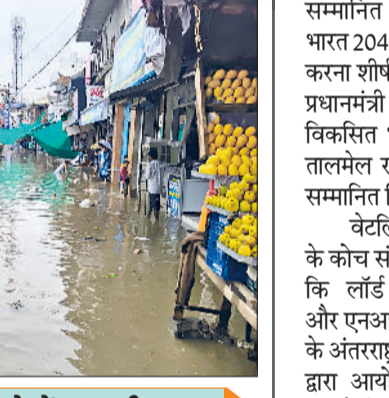
तोशाम। बारिश के पानी के साथ बह कर आए लकड़ी के तकत और कस्बे में जमा बारिश का पानी का दृश्य।

वाली जगहों पर पहुंच गए। दोपहर बाद दुकानदार पानी में घुसकर लकड़ी के तकतों को ढूढ़ते नजर आए। उल्लेखनीय है कि रविवार दोपहर करीबन 2 बजे तोशाम कस्बे में अचानक मानसून की पहली बरसात ने दस्तक दी और यह बारिश इतनी तेज थी कि देखते ही देखते करीबन मात्र 40 मिनट की बारिश से ही तोशाम शहर जलमग्न हो गया और कस्बे के राजीव नगर, पुराने बस स्टैंड के