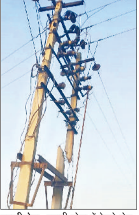
बवानीखेड़ा। बवानी खेड़ा में रेलवे रोड पर स्थित कंडम दशा में बिजली का पोल व खेतों में लगा कंडम पोल।

बवानी खेड़ा में बिजली निगम द्वारा वर्षों पहले लगाए गए पोल जिनकी हालत बिल्कुल दयनीय हो चुकी है और ये कंडम हो चुके हैं व एक दूसरे के सहारे टिके हुए। यूं तो क्षेत्र में अनेकों ऐसे पोल हैं जिनकी सुध नहीं ली गई। लेकिन रेलवे रोड पर स्थित स्कूल के पास, हनुमान ढाणी, बस स्टैंड आदि अनेक स्थानों पर ऐसे पोल हैं जो टूटे होने के कारण हादसों को निमित्त दे रहे हैं। रेलवे रोड पर लगे पोल जिसके पास से प्रतिदिन हजारों की संख्या में छात्र-छात्राएं इसके पास से निकलती हैं किसी भी समय हो सकता है इन पोलों की वर्षों से कोई सुध नहीं ली गई। बताया जाता है कि इनसे किसी भी समय हादसा हो सकता है। दो दिन पहले कंडक्टर टूटने से बाल बाल बचे थे। राजकीय वरिष्ठ