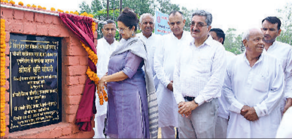
भिवानी। लिफ्ट इरीगेशन व्यवस्था के पुर्ननिर्माण के लिए आधारशिला रखवाते हुए।

दक्षिण हरियाणा के ऊंचाई में स्थित रेगिस्तानी क्षेत्र में फसलों की सिंचाई के लिए वर्ष 1970 में शुरू की गई जल उठान सिंचाई परियोजना (लिफ्ट इरीगेशन) को फिर से नए सिरे से तैयार करने का कार्य शुरू कर दिया गया है। इसको लेकर राज्यसभा सांसद किरण चौधरी ने आज चौ. बंसीलाल कैनाल, जिसे पहले जुई फौडर कहा जाता था, वहां