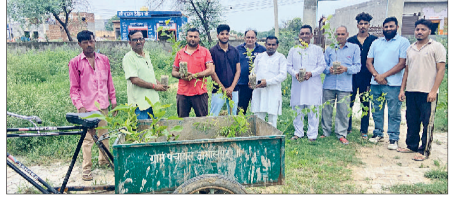
मिवानी। गांव जमालपुर के शमशानघाट में पौधरोपित करते हुए।

देश के महान सपूत डा. श्यामा प्रसाद मुखर्जी की जयंती के अवसर पर रविवार को गांव जमालपुर में एक अनूठी पहल की गई। गांव के शमशान भूमि पर 70 विभिन्न प्रकार के पौधे रोपित कर पर्यावरण संरक्षण और दिवंगत आत्माओं को श्रद्धांजलि अर्पित की गई। इस कार्यक्रम में स्थानीय ग्रामीणों, युवाओं और जनप्रतिनिधियों ने बढ़-चढ़कर हिस्सा लिया।